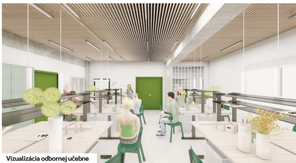
Vizualizácia odbornej učebne

Pokračovať bude aj vzdelávanie v oblasti techniky a prevádzky dopravy vrátane logistických činností, so zvažovaným tematickým prepojením na poľnohospodárske a technologické odbory, aby bol tento odbor kompatibilný s celkovým profilom kampusu. Významnou súčasťou ponuky bude aj nová perspektívna špecializácia v oblasti životného prostredia a vodného hospodárstva, zameraná na vodu, krajinné systémy a environmentálnu ochranu, podporená modernou a adekvátnou infraštruktúrou.