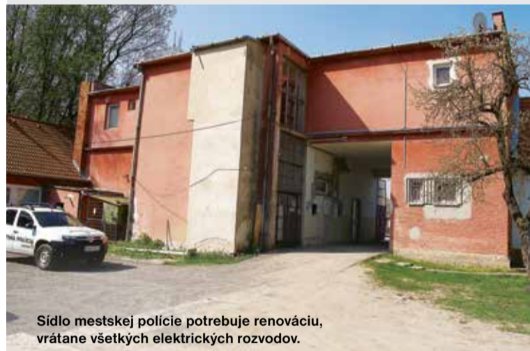
Sídlo mestskej polície potrebuje renováciu, vrátane všetkých elektrických rozvodov.

Medzi najakútnejšie patrí budova zdravotného strediska. Na tejto budove sa podpísal čas a niektoré veci sa už nedajú odkladať. Nakoľko ide o zdravotnícke zariadenie, musíme ho udržať v prevádzke, ktorá spĺňa štandardy hygieny a bezpečnosti. Veľké vrásky nám robí strecha zdravotného strediska, ktorá spolu s odkvapovým systémom je v nevyhovujúcom stave a spôsobuje zatekanie do ambulancií. Čiastkové lepenie už nepomôže, strechu treba vymeniť najmä v hlavnej časti budovy, spolu s odkvapovým systémom a bleskozvodom. Ďalším problémom sú zastarané vnútorné inštalácie. Dôkazom ich kritického stavu sú pravidelne odstraňované havárie vo vnútri objektu. V poslednom rade je potrebné vyregulovať kúrenie v celom objekte, vymeniť všetky termostatické hlavice a programovo vykurovať budovu v súlade s ordinačnými hodinami v jednotlivých ambulanciách. Tu vieme ušetriť až 40 percent nákladov na príslušné energie.