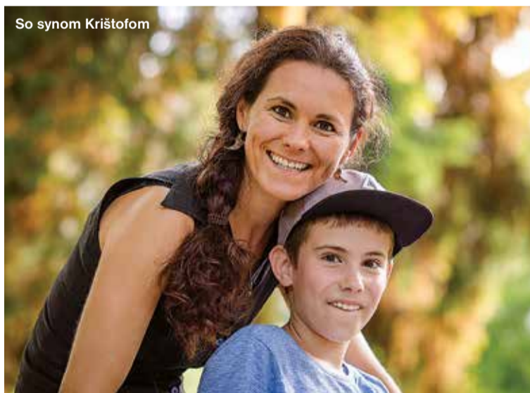
So synom Krištofom

„Je mi ľúto, ako sa nám zo života vytráca spolupatričnosť a solidarita.“