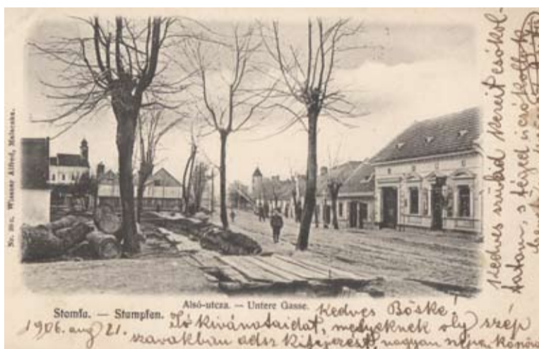
Pohľad na dolný koniec Hlavnej ulice začiatkom 20. storočia.

Stupavský kronikár Jozef Krištoffy uvádza, že vo veľkej zime roku 1928 v Stupave úplne vyhubilo všetky gaštany. Nebol to však mráz, ktorý dal gaštanom smrteľný úder, ale hustnúca automobilová premávka. Jeden rad gaštanovej aleje bol vyrúbaný v roku 1968 pri rozširovaní cesty. Nepomohli slzy, ústne ani písom-