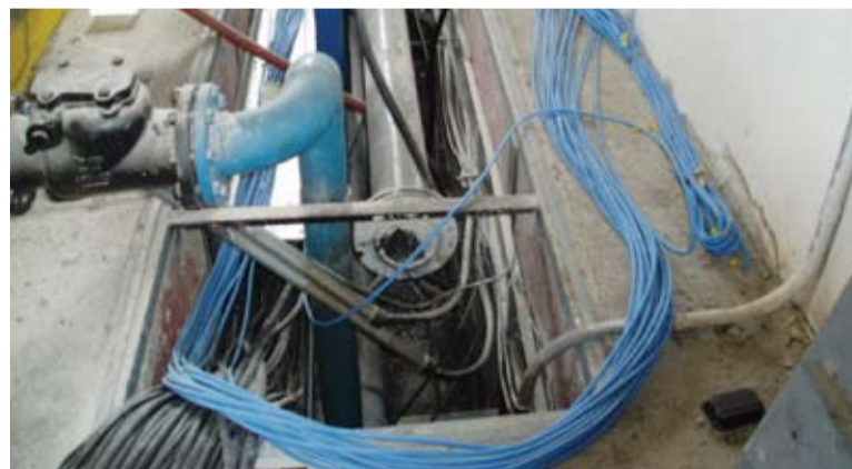
Rekonštrukcia káblových rozvodov