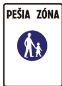
Informatívna prevádzková značka IP 25a

v doprave. Význam dopravných značiek, dopravných zariadení a osobitných označení v zmysle II dielu, článku 5, ods. 35, Vyhlášky Ministerstva vnútra SR č. 9 z 20 decembra 2008 ktorou sa vykonáva zákon o cestnej premávke a o zmene a doplnení niektorých zákonov: