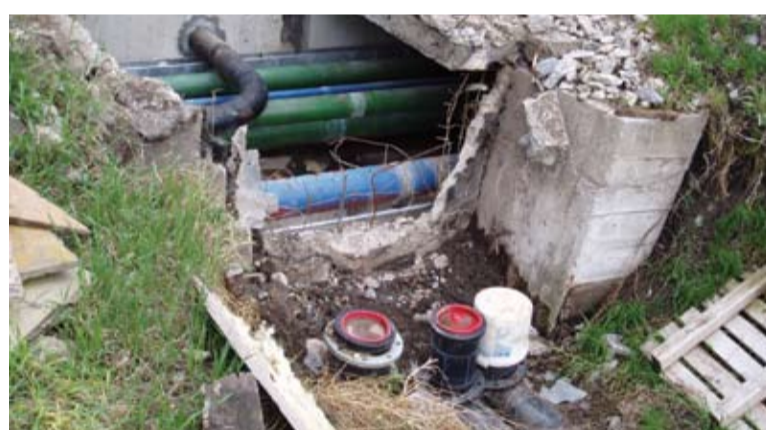
Prepojovanie novej a starej ČOV