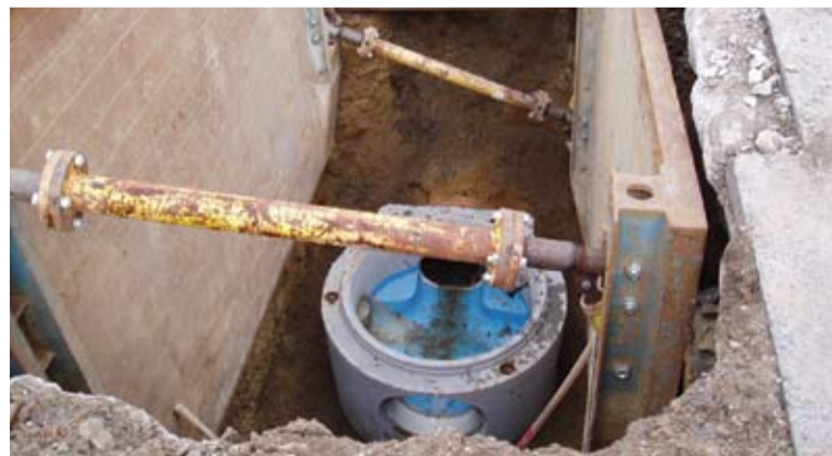
Práce na prepojovacom uzle Vajanského - Dlhá - Kúpeľná