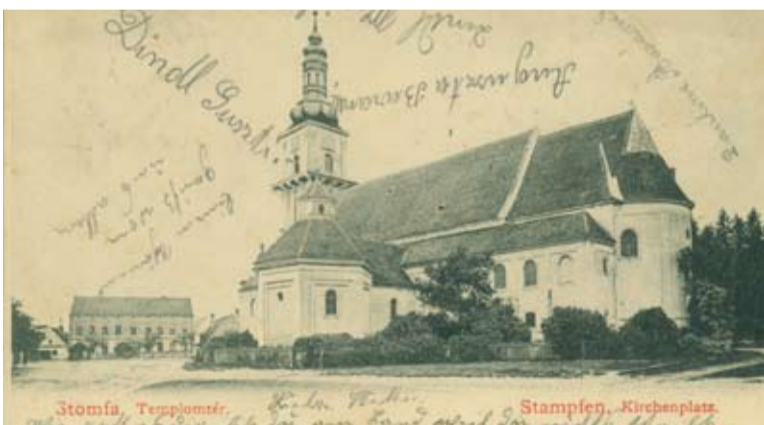
Kostol sv. Štefana pred požiarom

boli požiare v minulosti obávanou a reálnou hrozbou. Z dejín Stupavy ich poznáme približne stovku, tie