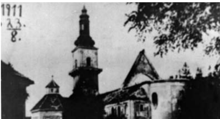
Kostol sv. Štefana po požiaru v roku 1911