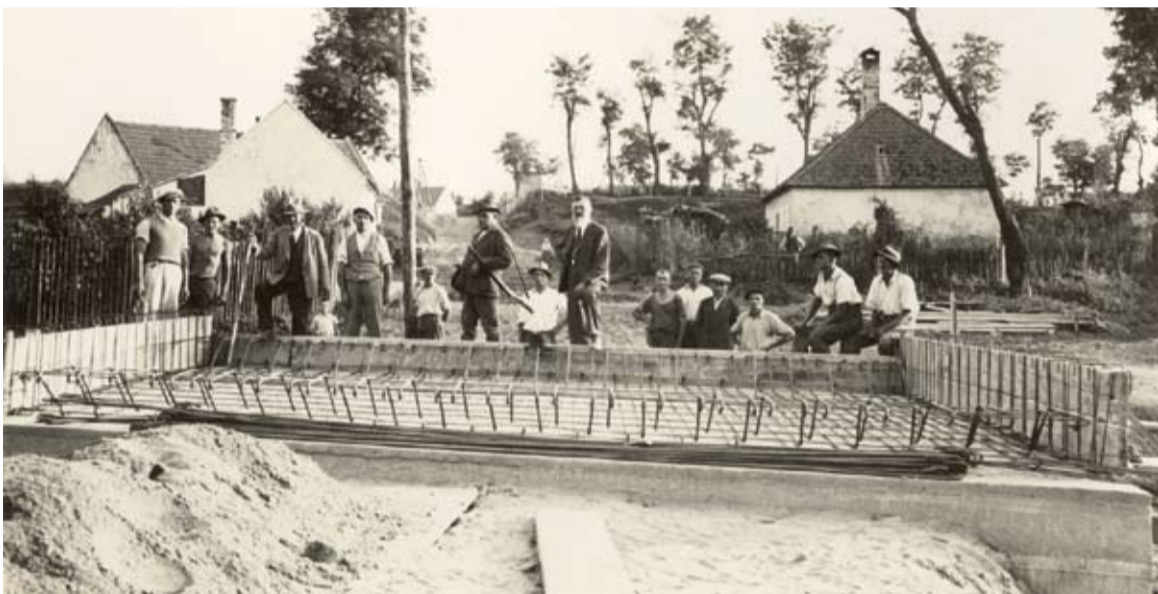
Výstavba betónového mosta v roku 1937