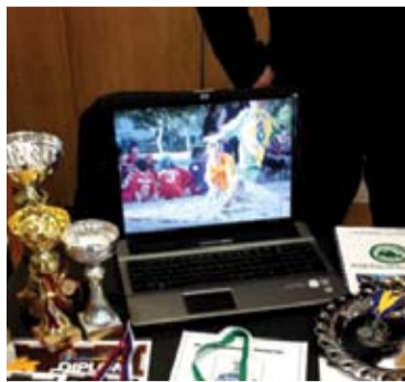
Hádzanársky klub Stupava