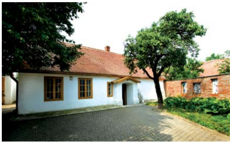
Celkový pohľad na budovu Múzea Ferdiša Kostku

Slávne stupavské múzeum s expozíciou venovanou výnimočnému slovenskému keramikárovi - figuralistovi - Ferdišovi Kostkovi (1878-1951) dnes už žije iba virtuálne. Internetové odkazy s informáciou, že múzeum je v prevádzke, záujemcom smelo opisujú vzácne vystavované predmety z tvorby stupavského rodáka, jeho keramickú dielňu a jedinečnú habánsku pec z 18. storočia - najstaršiu na Slovensku. Farebné fotky s popisom, kontaktnými informáciami a uvedenými otváracími časmi sú lákavou pozvánkou do nášho mesta. V skutočnosti tu už niet čo otvárať. Miestny kultúrny klenot s podmočenými základmi a praskajúcou stenou opúšťajú posledné zbierkové predmety.