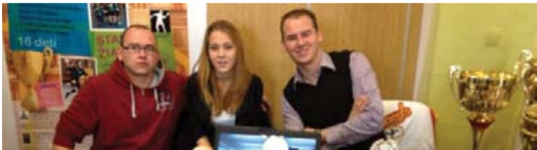
Bowling Club SIX PACK Stupava