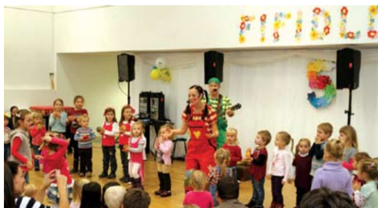
Deti oslavovali so Spievankou a Zahrajkom