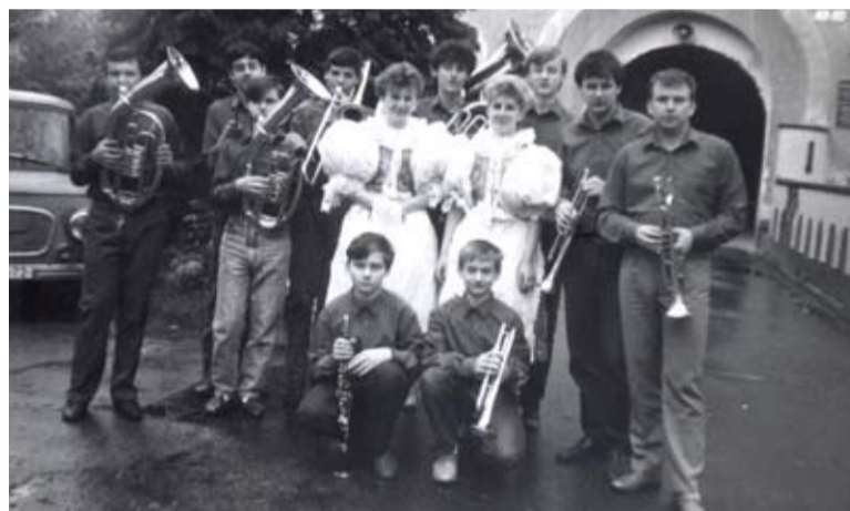
Záhorienka pred 25 rokmi.