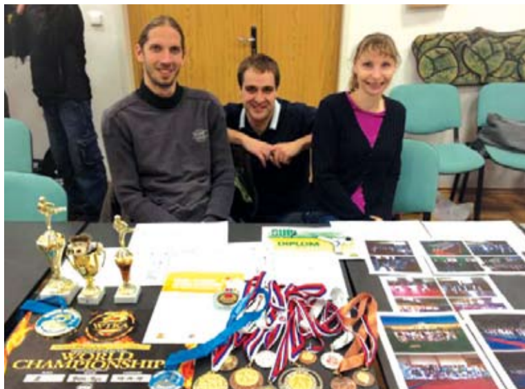
SK Karate Dojo Stupava