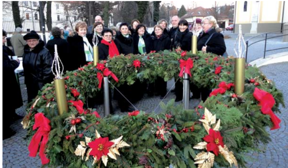
Adventný veniec na Námestí sv. trojice v Stupave