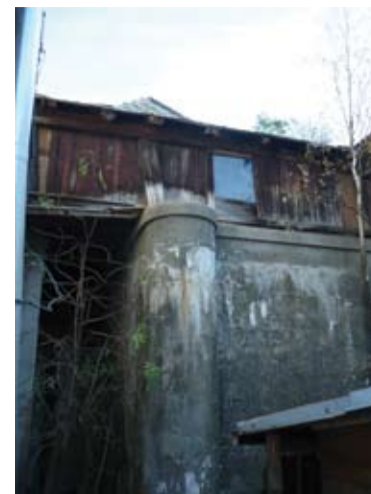
Stavebné úpravy pre náhon vody

motnú pílu - objekt píly a gáter využívali Štátne lesy do 60 - tých rokov 20. storočia, ale už napojené na normálny rozvod el. energie.