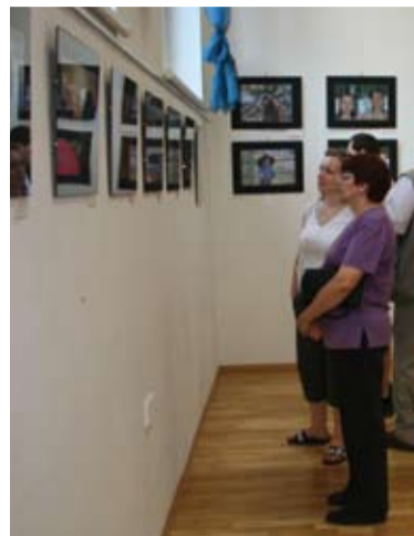
Z vernisáže výstavy, 14.8.2011

Každá Vaša fotografia sa spája s osobitým príbehom. Ktorý Vám najviac utkvel v pamäti? Ku ktorému zážitku sa najradšej vraciate?