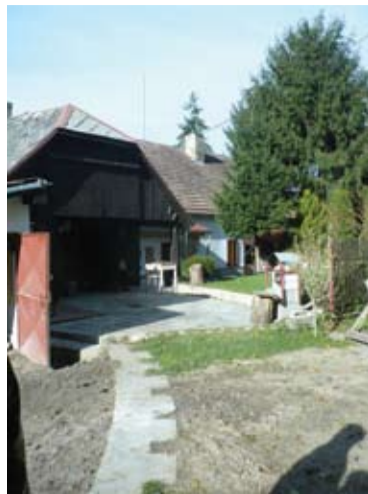
Do tejto dielne bol zaústený kanál

Technické parametre elektrárne nepoznáme, ale zvyšky zariadení bolo tam vidieť ešte v šesťdesiatych rokoch minulého storočia. Sa-