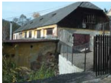
Budova píly, dnešný stav