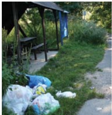
Odpočívadlo na rázcestí

Výbudované cyklochodníky boli financované z prostriedkov EÚ. Prijímateľom pomoci resp. nenávratných finančných prostriedkov boli rôzne subjekty, ktoré určitým spôsobom, aby získali podporu pre svoj projekt, deklarovali udržateľnosť svojho zámeru. Je pravdou, že doba trvania projektu je 5 rokov po jeho ukončení. Znamená to, že mnohé cyklochodníky sú dnes bezprízorné, teda nemajú správcu, ktorý sa zaručil, že budú funkčné. Správcom spomínaného cyklochodníka teda v žiadnom prípade