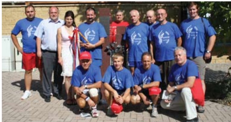
Účastníci Behu vďaky s primátorom a hlavnou kontrolórkou mesta Stupava