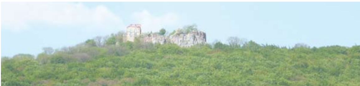
Pajštúnsky hrad, ilustráč. foto