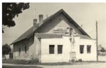
Budova požiarnej zbrojnice