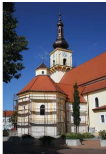
Pohľad na kostol z východu (september 2011)

behla už pred desiatimi rokmi, ale vtedy sa nerekonštruovali, či nepridávali tie časti, ktoré sú momentálne nevyhnutné (sokel, odvlhčenie). Keď sa robila rekonštrukcia Námestia sv. Trojice v (r. 2007) sa čiastočne poškodila fasáda. Bolo potrebné urobiť kroky k náprave. Samozrejme, že priebežná údržba kostola sa robí. Ako každý rodinný dom, aj náš kostol potrebuje niekedy menšie opravy, či úpravy.