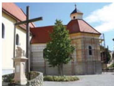
Pohľad na kostol zo západu (september 2011)