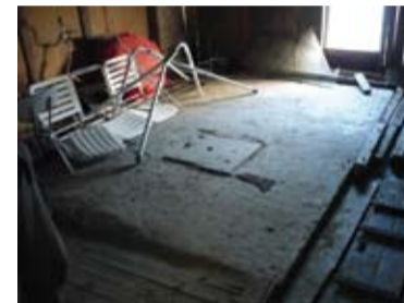
Zásobník na vodu