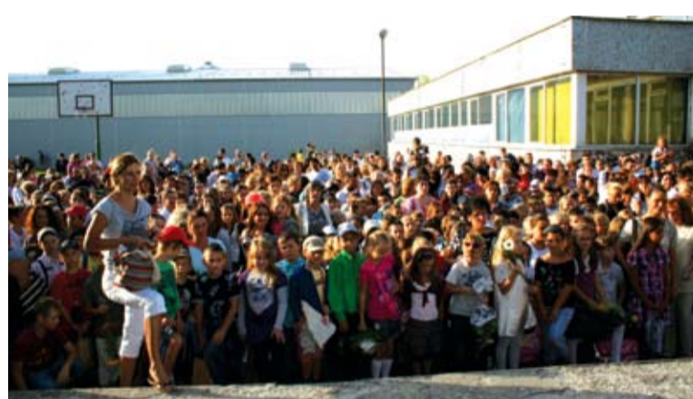
Slávnostné zahájenie školského roka sa konalo na školskom dvore

Historickým sa stalo vianočné vystúpenie v prezidentskom paláci v decembri 2008, kde zbor Nevädza