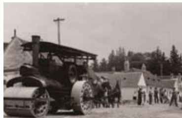
Štrkovanie Marcheggskej ulice v roku 1932

zastupiteľstvo vhodný pozemok na výstavbu novej meštianskej školy. Jeden z návrhov bol postaviť novú školu na pozemkoch školských záhrad. Návrh bol neskôr z hygienických dôvodov zamietnutý, dôvodom bol šíriaci sa zápch z hnojiska v neďalekom Veľkom majeri. Novú meštianku napokon postavili na Hlavnej ulici. Marcheggská ulica bola v minulosti pomerne frekventovanou cestou. Svedčí o tom aj fakt, že v noci bola osvetlená plynovými, neskôr elektrickými lampami. V roku 1932 prebehla úprava Marcheggskej ulice, bolo vykonané plánovanie, štrkovanie v dvoch vrstvách a valcovanie. Súčasťou bolo aj čistenie a prehlbovanie dažďových rigolov. V neskoršom období jej povrch pokryli betónom, spolu so Záhradnou a Cementárskou ulicou tvorili príjazdovú cestu do Stupavskej cementárne. V období socializmu bola premenovaná na Fučíkovu ulicu. Názov dostala po českom komunistickom novinárovi a spisovateľovi