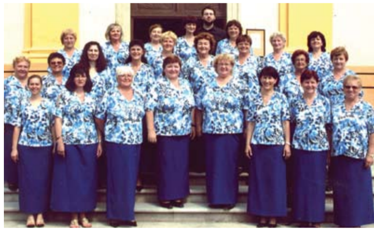
Ženský spevácky zbor Nevädza zo Stupavy