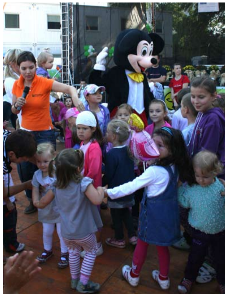
Program pre deti a detské atrakcie nechýbali ani tento rok (30. 9.–2. 10. 2011)