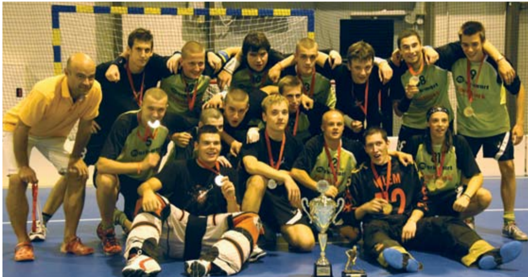
Družstvo BOGDAU Stupava skončilo v kategórii B92 na prvom mieste

Najmladší stupavský bociani sa predstavili v kategórii B99 ( 8 účastníkov). Cenný kov im unikol len o vlások, pretože zápas o bronz prehrali až po samostatných nájazdoch. 3.miesto si tak vybojovalo družstvo NOKIA SZPK Komárom z Maďarska. Zlato spravodlivo putuje do Nižnej po suverénnom priebehu turnaja i jasnom finále proti porazenému Snipers Bratislava.