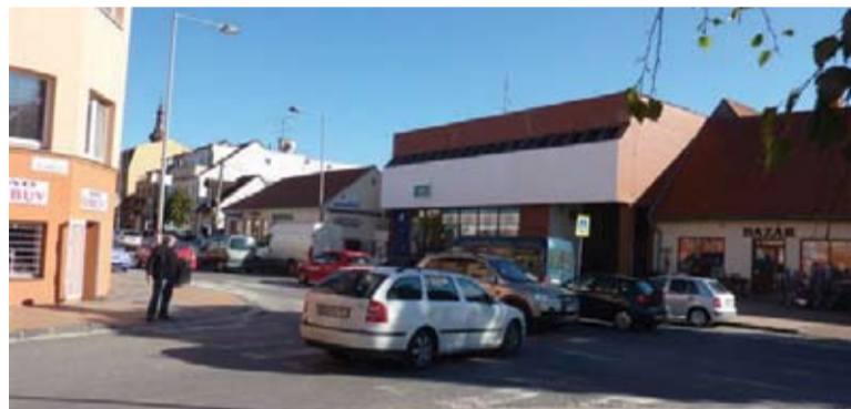
Križovatka Mlynská - Hlavná.