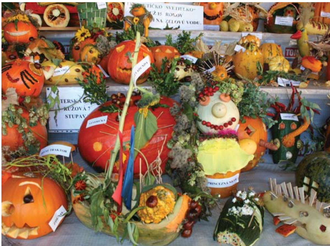
Na Výstavu dyňových strašidiel svoje diela priniesli jednotlivci i kolektívy (30. 9. –2. 10. 2011)