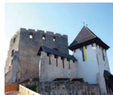
Hrad Celje, Slovinsko.

Posledným zahraničným podujatím, kde mohli návštevníci počuť o našom meste vďaka pokriku: „Ursus, Stupava, Slovačka!“ bol chorvátsky Renesančný festival, ktorý sa každoročne koná v meste Koprivnica. Jedná sa o najväčší historický festival v Chorvátsku, čo dôstojne dokazoval od prvého okamihu ako sme vystúpili z našich áut. Na kopci a pod ním v bezprostrednej blízkosti centra mesta sa rozprestieral zdanlivo nekonečný rad stánkov, historických táborov a dobových krčiem so senom a svojimi vývesnými štítmí. Všetko bolo ohradené imponantnou drevenou hradbou, ktorá v noci svietila do tmy tisícom mihotavých svetielok. Na festivale sa zúčastnilo množstvo skupín a účinkujúcich z Chorvátska, Slovinska, Slovenska, Česka, Maďarska a Talianska. Pre divákov bol pripravený naozaj intenzívny historický zážitok, ktorý pozostával z vystúpení, prehliadok, dobovej bitky, hudobných a tanečných prezentácií a množstva sprievodných akcií.