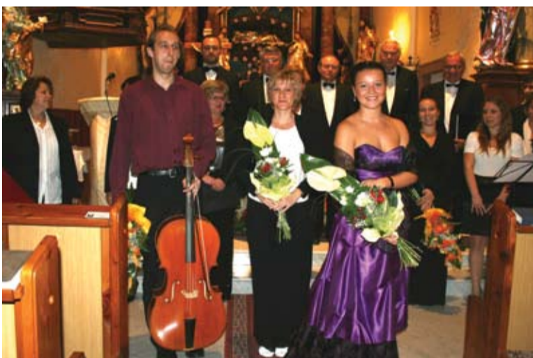
Koncert Hudba starých majstrov v Kostole sv. Šebastiana a Rocha v Máste (29. 9. 2011)