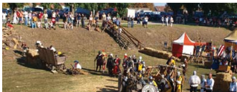
Renesančný festival v Koprivnici, Chorvátsko.