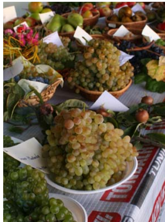
S láskou vypestované plody z výstavy Úroda 2011 (30. 9.–2. 10. 2011)