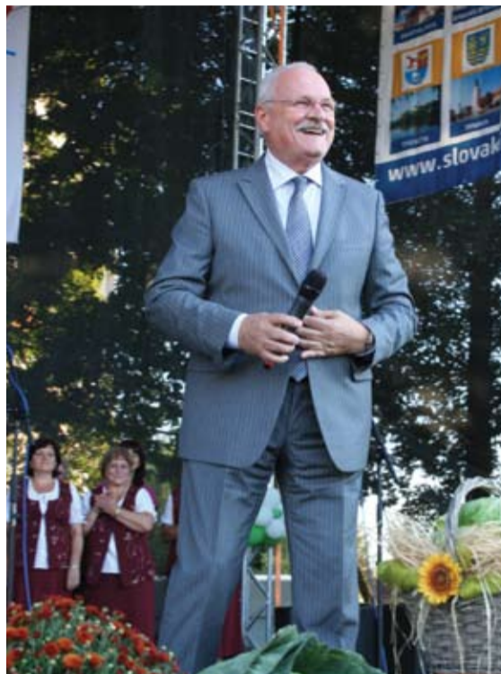
Prezident SR Ivan Gašparovič slávnostne zahájil podujatie akceptovaním regúl Dňa zelá a uložení košíka s kapustou na podstavec na pódiu (30.9.2011)