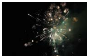
Podujatie tradične ukončené ohňostrojom