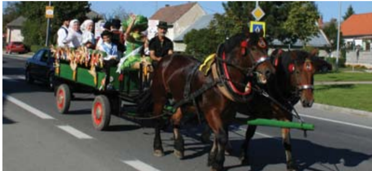
Zvolávačka – voz a "kyselé zelé" s úsmevom od FS Chasa (30. 9. 2011)