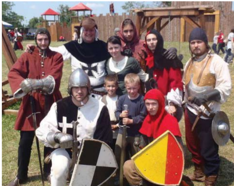
SHŠ URSUS na Rytierskom turnaji vo Sv. Helene, Chorvátsko.

Leto skončilo, začína jeseň a na dvere klope zima. Veľké školské prázdniny sú už za nami, skončila aj letná kultúrna sezóna. Počasie je čoraz chladnejšie a sychravejšie. Dovoľte však, aby sme Vám ešte na chvíľu pripomenuli letný čas a priniesli do Stupavy posledné teplé slnečné lúče. A nie hocaké - budú to rovno lúče z ďalekého Slovinska a Chorvátska! V nasledujúcom článku si totiž zaspomíname na zahraničné vystúpenia, ktoré absolvovali združenia Ursus a Eliah počas sezóny v roku 2011.