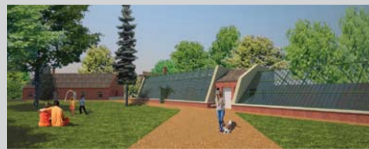
Vizualizácia obnovy skleníka a Krupičkovho domu, Ateliér KLiKA.

S príchodom teplejšieho počasia bola 16. apríla zorganizovaná brigáda na vyčistenie skleníka od odpadkov a odborné zrezanie náletových stromov v jeho priestoroch. Zároveň bolo vyčistené aj okolie pred bývalou skleníkovou kotoľňou. Odborné zrezanie stro-