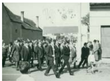
Vyústenie dnešnej Zdravotníckej ulice po asanovaní bývalého hostinca.

Po výstavbe Základnej školy na Hlavnej ulici (vyučovať sa v nej začalo v roku 1947) vznikali problémy s jej dostupnosťou. Zamestnanci školy a najmä deti, ktoré nebývali na Hlavnej ulici, prichádzali do školy cez Mlynskú ulicu. Začiatkom 60-tych rokov dvadsiateho storočia nastala v Stupave výstavba nových ulíc a bytových domov. Okrem dnešnej Zdravotníckej ulice vznikli v tom čase napríklad aj Ružová, Bezručova a Budovateľská ulica. Pre plánované sídliská bola vyčlenená plocha západne od Hlavnej ulice. Z tohto dôvodu pripadli dotknuté domy na Hlavnej ulici do asanačného pásma,