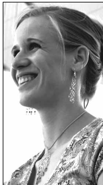
Rozhovor pripravila Miriam Šlauková. Celý obsah si môžete prečítať na www.pourart.sk .