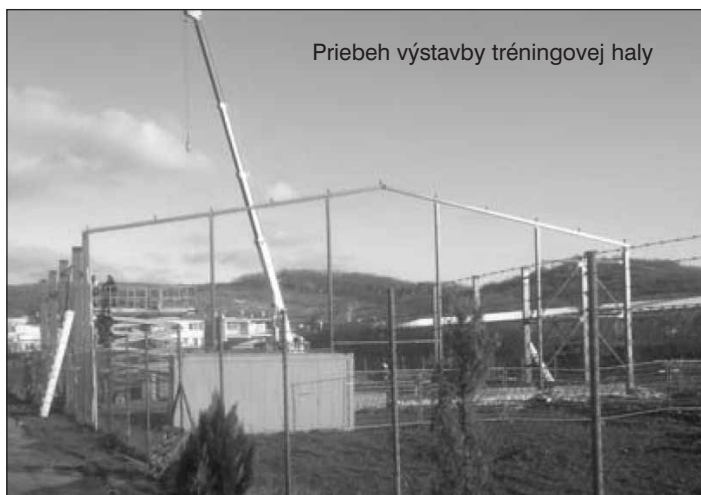
Priebeh výstavby tréningovej haly