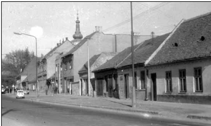
Hlavná ulica okolo roku 1965