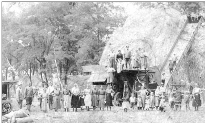
Sezónne práce na veľkostatkoch boli príležitou na dobrý zárobok.