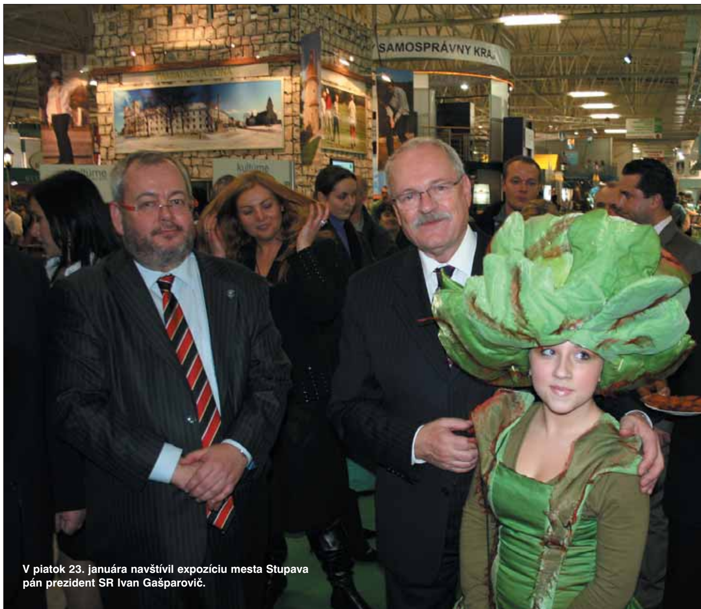
V piatok 23. januára navštívil expozíciu mesta Stupava pán prezident SR Ivan Gašparovič.