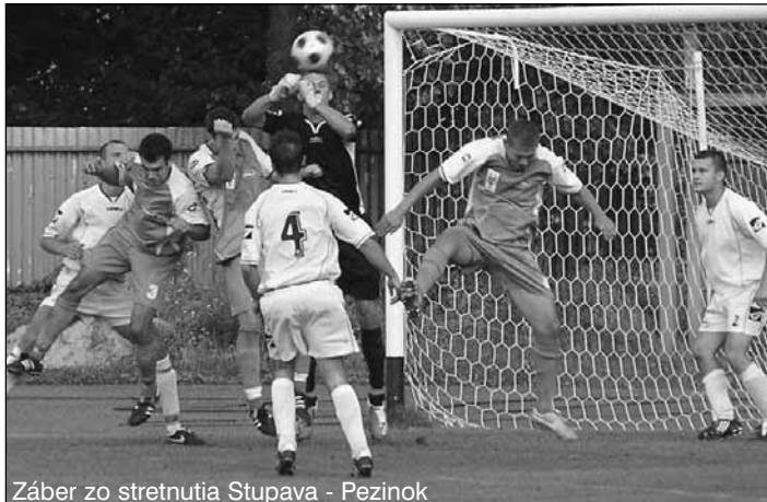
Záber zo stretnutia Stupava - Pezinok