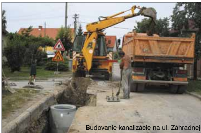
Budovanie kanalizácie na ul. Záhradnej

V časti projektu INTENZIFIKÁCIA ČOV sa postupne zahájili práce na výstavbe nových stavebných objektov: