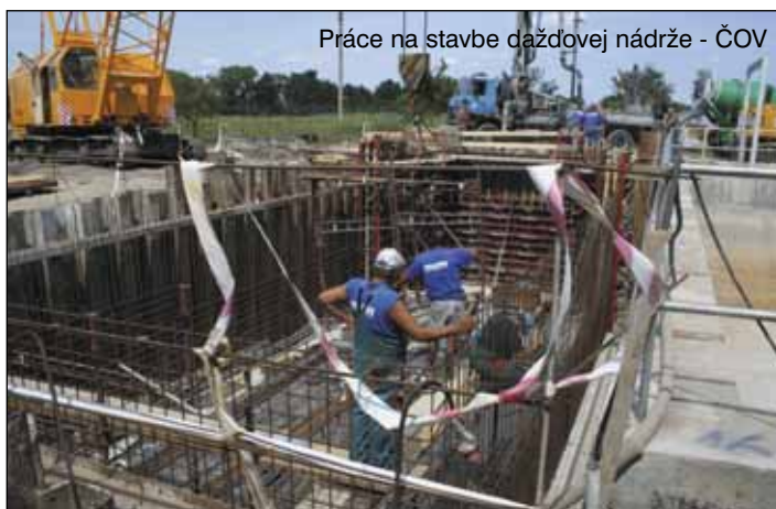
Práce na stavbe dažďovej nádrže - ČOV

Od ČS bola budovaná ďalšia kanalizačná vetva „E 1“ na ul. Bottova v dĺžke 141 m spolu s domovými prípojkami. Práce pokračovali na kanalizačnej vetve „E2“ od ČS po ul. Dolná a Záhumenská v dĺžke 475 m a taktiež boli realizované domové prípojky. V súčasnosti s realizáciou prác na vetve „E2“ bol realizovaný aj výtlač v dĺžke 500 m od ČS na Bottovej ulici až do poslednej jestvujúcej šachty na ulici Záhumenská. V súčasnosti na tomto stavebnom úseku t.j. ulíc Bottova, Dolná, Záhumenská sú realizované spätné úpravy terénu záverečným asfaltovaním.