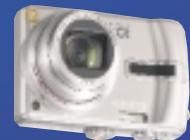
+ darček fotoaparát Panasonic DMC-TZ2

AKCIOVÁ PONUKA je platná do vypredania zásob