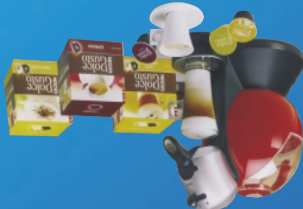
KRUPS - NESCAFÉ DOLCE GUSTO

SONY NWZ815 2.690,- MP3 prehrávač SONY, obrazovka 2" QVGA (320x240), pamät 2 GB, MP3, AAC, WMP, WMA, MPEG4, AVC, JPEG vstavaná batéria - výdrž 33 hodín hudby, 8 hodín videa