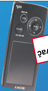
MP3 prehrávač 2 GB

SONY DCR-DVD 109 E 9.999,- DVD videokamera, objektív Carl Zeiss Vario Tessar, DVD-RW, DVD-R na 8 cm médiu, 1 CCD kamera, elektro-nická stabilizácia obrazu, nočné snímanie