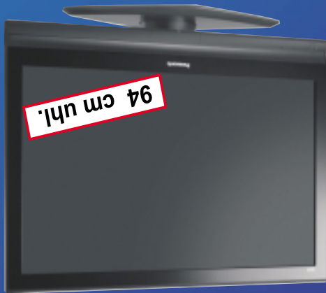
94 cm uhl.