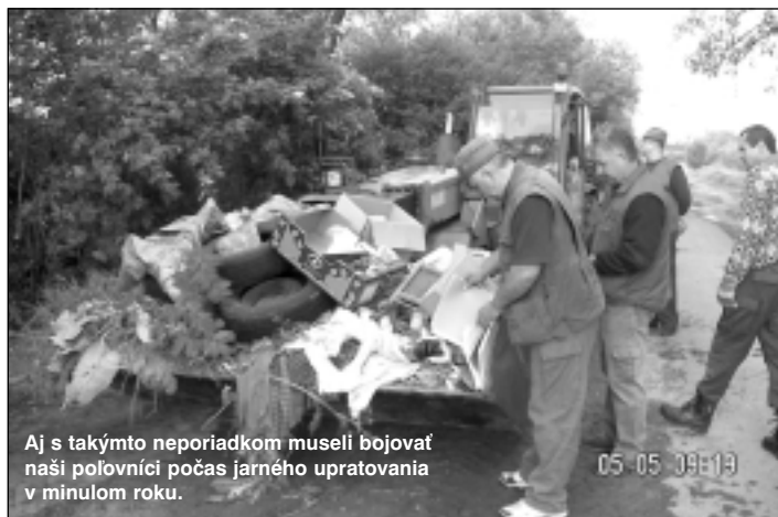
Aj s takýmto neporiadkom museli bojovať naši poľovníci počas jarného upratovania v minulom roku.

Do jarného upratovania sa už tradične zapájajú členovia miestnych organizácií a združení: Dobrovoľný hasičský zbor, Družstvo podielnikov, Základná škola, Diagnostické centrum mládeže i Poľovnícka spoločnosť. Práve pričinením našich poľovníkov je každoročne vyčistený chotár Bystrice od mnohých divokých skládok.