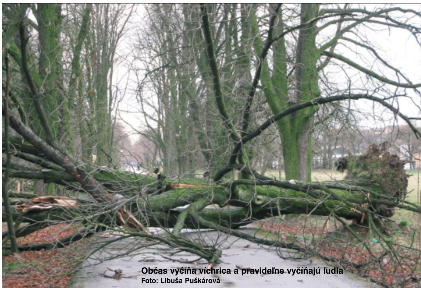
Občas vyčíňa víchrica a pravidelne vyčíňajú ľudia