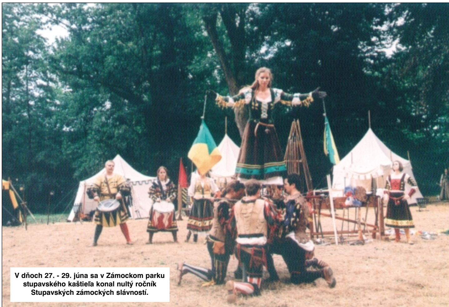
V dňoch 27. - 29. júna sa v Zámockom parku stupavského kaštieľa konal nultý ročník Stupavských zámockých slávností.

V tomto čísle si prečítate: Zasadalo mestské zastupiteľstvo v Stupave • Stanovisko Slovenskej pošty • Riešia výstavbu bytov • Cieľom je centrum mládeže • Projekt 40up v Stupave • Susedé susedom • Kultúrne leto v Ivančiciach • PLAYMINIHANDBALL - úspešný turnaj , dobrá reklama