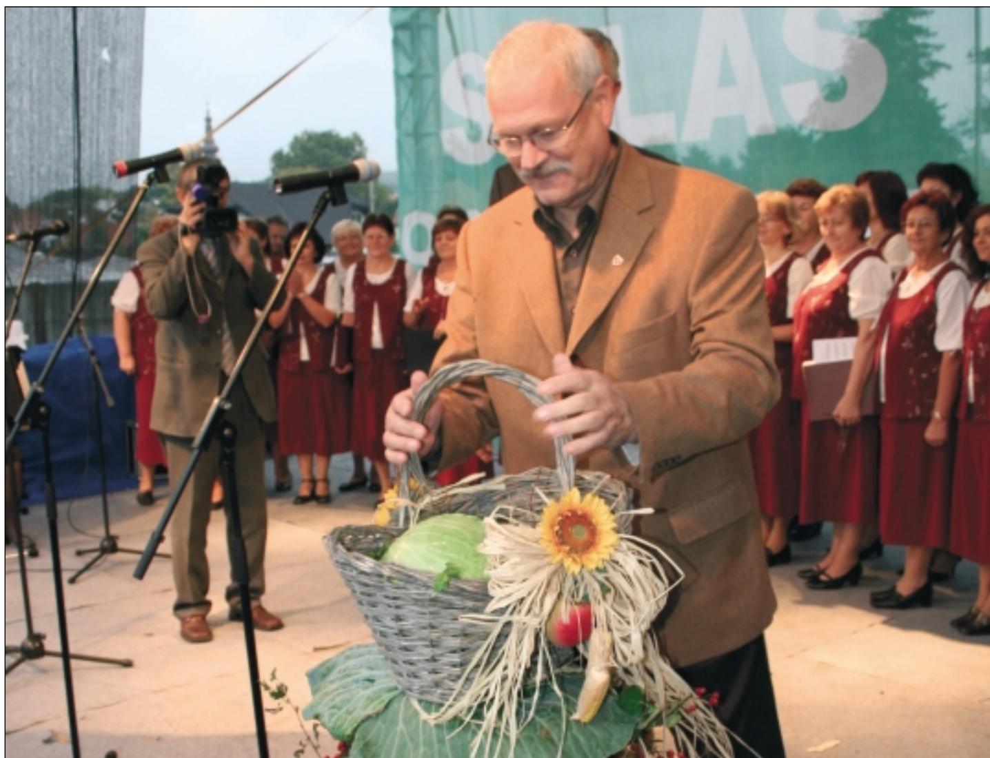
XII. ročník Dňa zelá 4. októbra otvoril prezident SR Ivan Gašparovič. Fotogaléria na str. 8-9.

V tomto čísle si prečítate: Parkovanie na námestí sa rieši • VYHLÁSENIE KANDIDATÚRY na nové voľby primátora v Stupave • Tvorivé dielne v múzeu • Hádzanársky reprezentačný turnaj žien v Stupave - SLOVAKIA CUP 2008 • STUPAVA FLORBAL CUP 2008