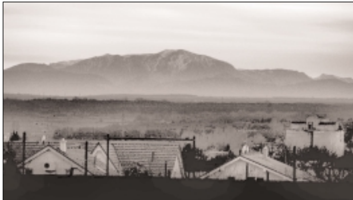
Autor: Dominik Katona (1988), študent Pedagogickej fakulta UK - Francúzsky jazyk a kultúra.

Na fotografii je hora Klosterwappen ležiaca v Rakúsku, v najvýchodnejšej časti pohoria Schneeberg, 70 km juhozápadne od Viedne. Je to najvyššia hora Dolného Rakúska a zároveň najvýchodnejšia Alpská dvojtisícovka (2076 m). A to dole pod ňou je mesto Stupava, od ktorého ju delí "iba" 110 km. Väčšina Stupavčanov už Alpy videla, ale málokto vie že za pekného počasia vidieť 50 km vzdialenú Viedeň! Ak vás nepresvedčia fotky: http://www.flickr.com/photos/14974675@N07/ odporúčam výhľad z rímskej stanice alebo z ulice Lesnej, odkiaľ môžete najlepšie pozorovať nielen zasnežené vrcholky Álp, ale aj nádherné západy slnka.