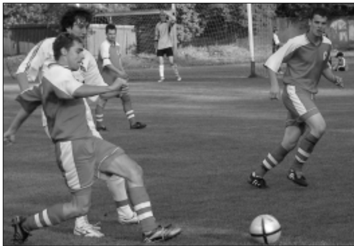
V popredí Polák v tmavom, zo stretnutia Stupava - Lamač.