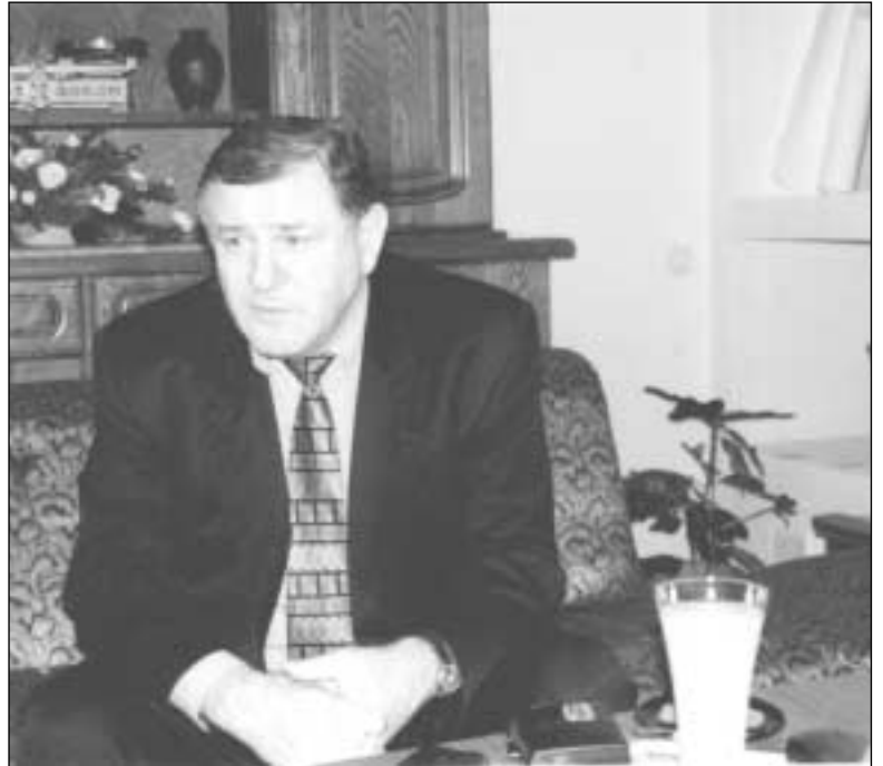
▲ Vladimír Mečiar poskytuje exkluzívne rozhovory regionálnym médiám. Na stretnutí vo Viničnom odpovedal tridsať minút len na otázky Podpajštúnskych zvestí. Čítajte na strane 5.