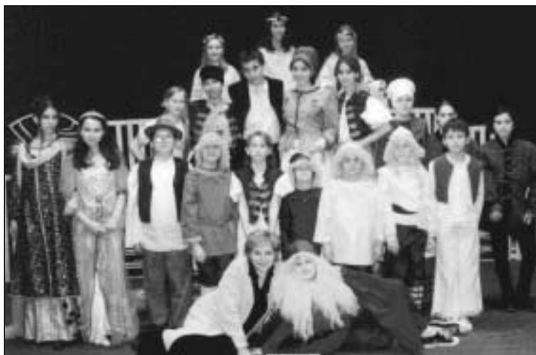
Divadelný súbor pri ZUŠ v Stupave pripravil inscenáciu Zlatá priadka a srdečne pozýva na slávnostnú premiéru v Kultúrnom dome v Stupave v sobotu 13. apríla o 17.00 hodine.