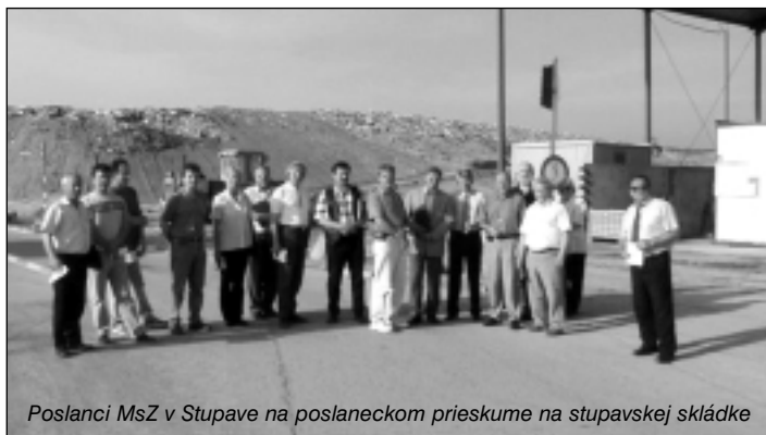
Poslanci MsZ v Stupave na poslaneckom prieskume na stupavskej skládke