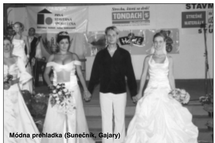
Módna prehľadka (Sunečník, Gajary)