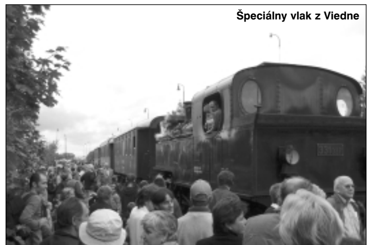
Špeciálny vlak z Viedne