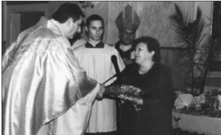
Medzi gratulantmi bola i starostka obce Zohor