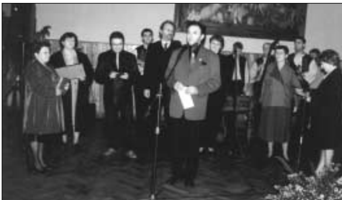
Z inaugurácie známky

skou fantáziou dotvorené dyne premenené na dyňové strašidlá. Podujatie v spolupráci s obec-