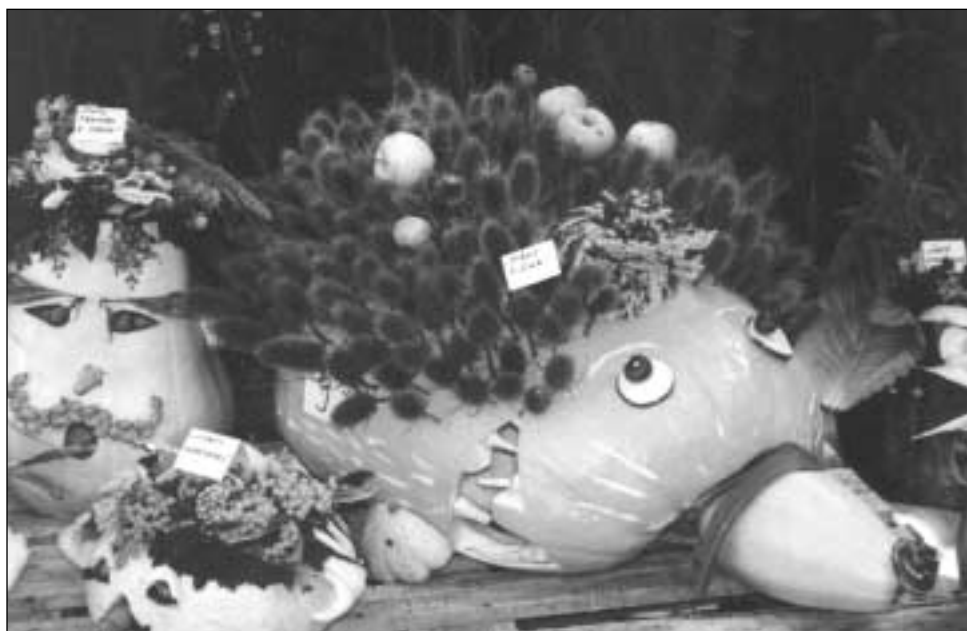
Deň zelá - Z výstavy dyňových strašidiel