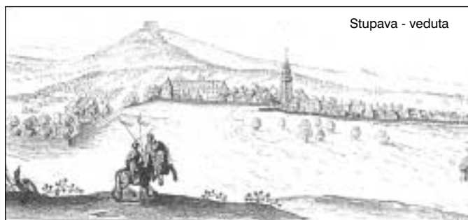
Stupava - veduta