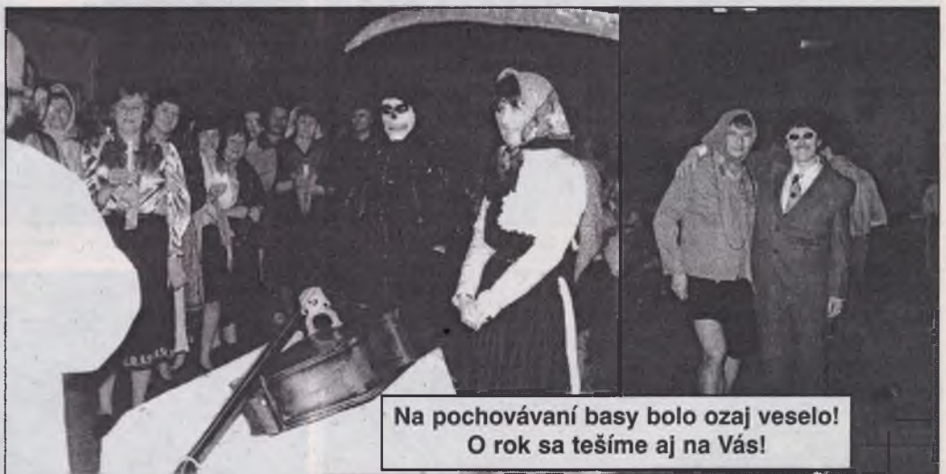
Na pochovávaní basy bolo ozaj veselo! O rok sa tešíme aj na Vás!

dajný, či vypovedá o skutočnom záujme ťažko povedať. Listok bol uverejnený dvakrát v celkovom náklade 3000 kusov. Okrem anketových lístkov nám niektorí napísali i svoj názor, ako napríklad: "Nie som o tom presvedčený, že sa vám podarí zistiť skutočný záujem o KT, pretože Stupavan je podpultový, nedostane sa do každej domácnosti, takže ten, kto by mal záujem sa nedozvie o akcii a to je škoda, lebo je to hanba, že v Stupave je taký mizerný TV príjem, ba čo horšie nepride vám žiadna firma nainštalovať antény. Povedia, že škoda investovať, aj tak nič nechytíte. Okolité obce už KT majú, aj v Stupave sa pred rokmi robil prieskum na KT, ale skončilo to neúspešne." Vážení spoluobčania, očakávame vaše názory na túto tému a sľubujeme, že ich zverejníme. Očakávame i návrhy na riešenie, pretože najväčším problémom i prekážkou sú chýbajúce financie. -ps-