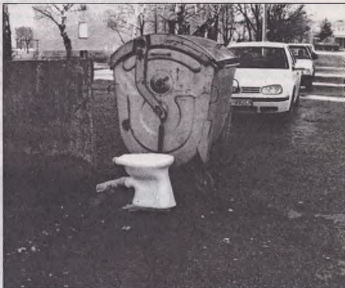
Sadnite si prosím, posedenie je pripravené (Ružová ulica)