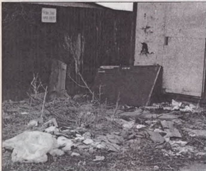
Býval tu kontajner, na ktorý si ľudia zvykli (pri bývalej Inchebe)

Organizačne zabezpečuje MsPTS Stupava, inf: 07/65934112, 65934213 p. Miština.