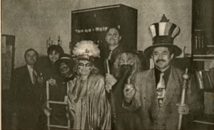
Starý rok, Nový rok a kominár s funkcionármi okresu Malacký a starostom obce