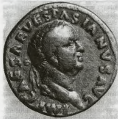
Aureus cisára Vespasiána, averz

Medzi numizmatickými nálezmi sa počas celého výskumu nevyskytla zlatá rímska minca! Zo zlata vôbec bol doteraz objavený, ešte počas výskumu V. Ondroucha, iba malý zlatý príviesok do ucha, ktorý sa našiel v priestoroch kúpeľov. Až desiatu výskumná sezóna v roku 1995 pod vedením bádateľov V. Turčana a I. Staníka bola mimoriadne úspešná.