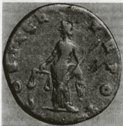
Aureus cisára Vespasiána, reverz

Vzácnym a výnimočným objavom bola zlatá rímska minca! V átriu veliteľskej budovy v prehádzanej vrstve zeminy premiešanej s rozpadnutou maltovinou a úlomkami tegúl sa našla rímska minca-aureus - cisára Vespasiána /69-79/ z dynastie Fláviocov. Minca je datovaná do r. 69 n.l. a je razená v mincovni v Ríme.