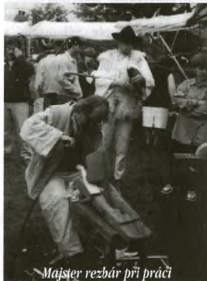
Majster rezbár pri práci