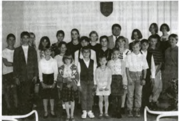
Najúspešnejší žiaci Základnej umeleckej školy na stretnutí s primátorom