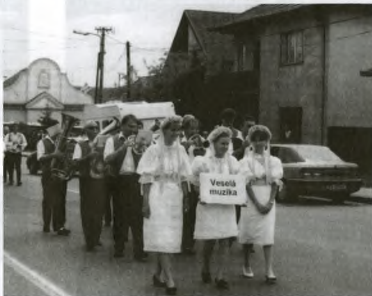
Veselá muzika zo Stupavy