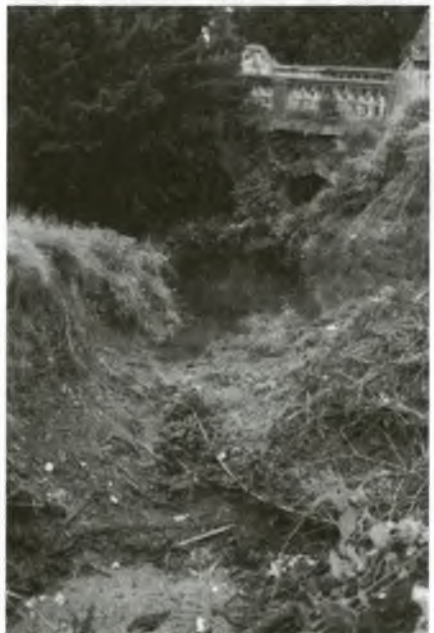
Vodná priekopa pri kaštieli

Primátor mesta ďakuje za obetavý, iniciatívny prístup pracovníkom Mestského úradu Stupava, Mestského podniku technických služieb Stupava, Vodárni a kanalizácií Stupava, dobrovoľným požiarnikom, príslušníkom Mestskej polície, pracovníkom Domova dôchodcov veleniu a vojakom pluku CO Malacky, pracovníkom Povodia Dunaja a občanom - Stupavčanom, ktorí sa podieľali na záchranných prácach počas povodne. Prejavili maximálnu obetavosť a ochotu pri riešení kritickej situácie, v ktorej bol ohrozený maj etok občanov i mesta. Ocenenie, ktoré bolo udelené mestu, je prejavom uznania a podakovania práve týmto ľuďom a patrí im naše úprimné podakovanie.