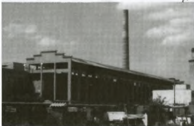
Posledný pohľad na cementársky komín

Presne tam, kde mu určili, rozsypal sa na tisícky tehál a úlomkov. Na streche budovy zostala hĺbka tehál a prach sadal na listy brezy „strešnej“, ktorá ďalej rastie, i keď už nie vedľa komína. Perfektnú prácu pochválili zvedavci, ktorí sa postupne vynárali z bezpečných úkrytov. Komín sa stal minulosťou, zmizol ako sa hovorí „len sa tak za ním zaprášilo“. Možno na chvíľu na prítomných okrem prachu sadla aj nostalgia za starou dominantou Stupavy, za komínom fabriky, ktorá ho už roky nepotrebuje.