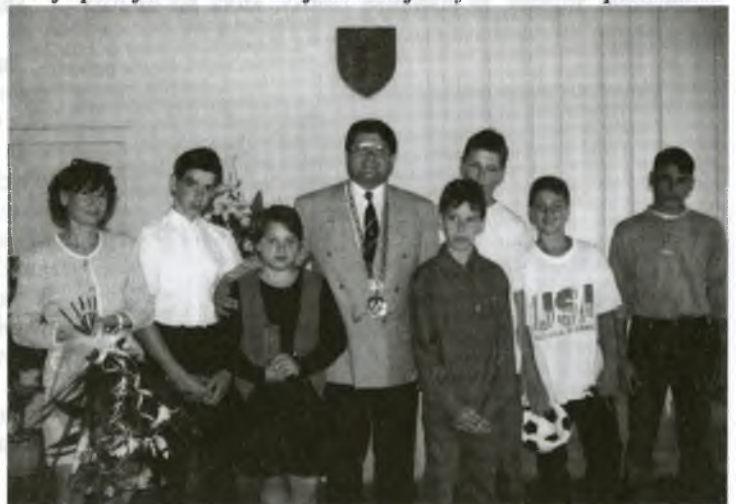
Najúspešnejší žiaci Osobitnej školy na stretnutí s primátorom