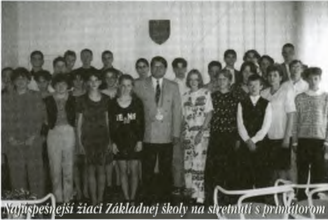
Najúspešnejší žiaci Základnej školy na stretnutí s primátorom