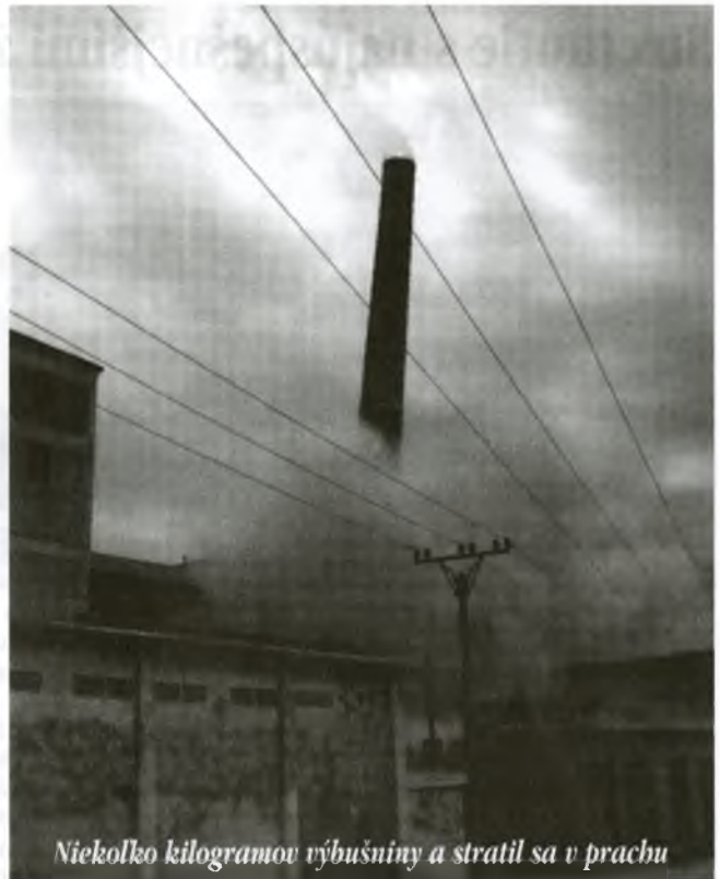
Niekoľko kilogramov výbušniny a stratil sa v prachu