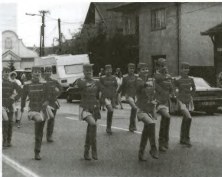
Mažoretky, Bože aká krása!