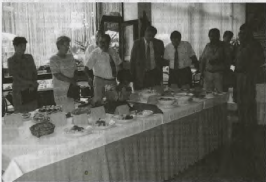
Porota je v rozpakoch? Po vizuálnom hodnotení nasledovala degustácia. Mňam...

Dňa 16. augusta v hoteli Stupava sa konalo vyhodnotenie súťaže Najlepší recept na kapustné jedlo. Do súťaže bolo zaradených 335 receptov od 192 súťažiacich z celého Slovenska. Vyhlásenie výsledkov bude dňa 28.9. počas Dňa zelá 97.