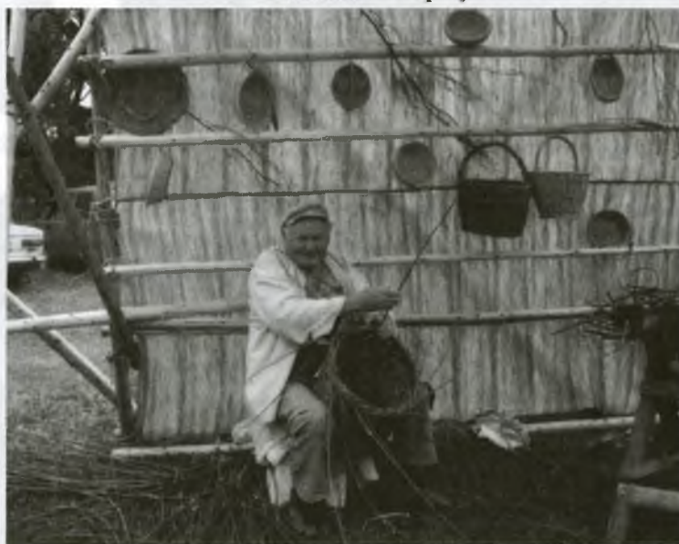
Majster košíkár - Svätjakubský jarmok