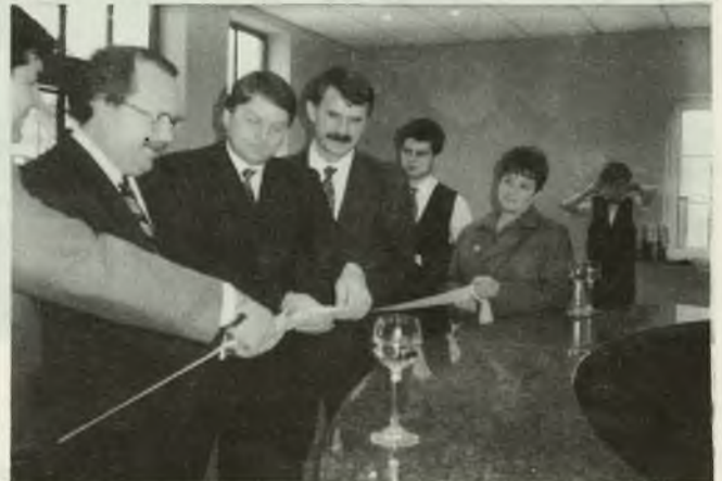
Slávnostné prestrihnutie pásky