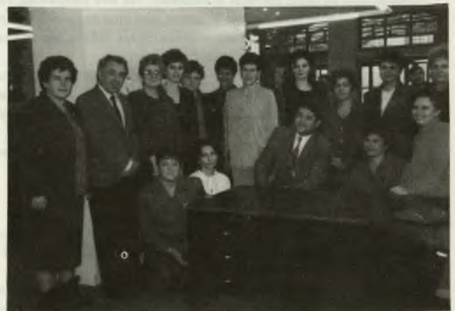
Kolektív pracovníčok pošty