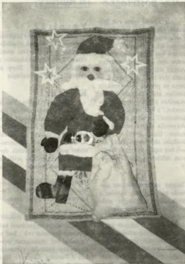
Z výstavy prác detí MŠ na ul. J. Kráľa