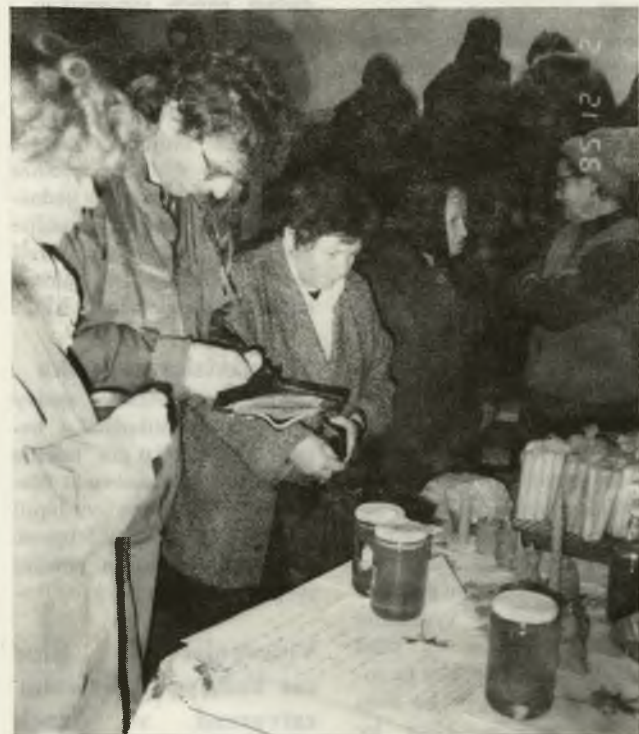
Vianočný jarmok v Kultúrnom dome