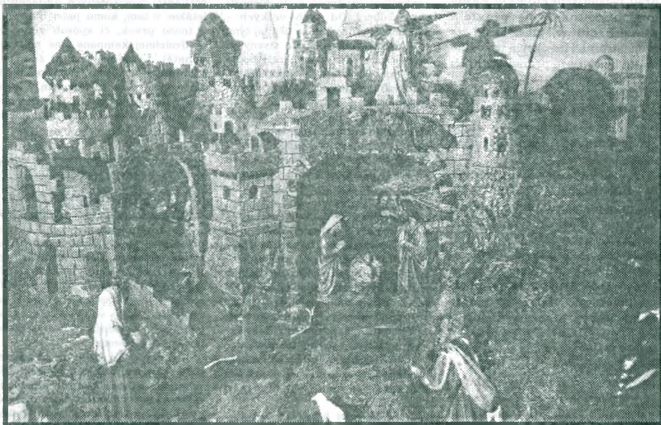
Betlehem farského kostola v Stupave