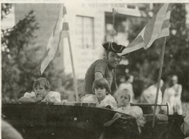
Najväčší zážitok mali tí najmenší