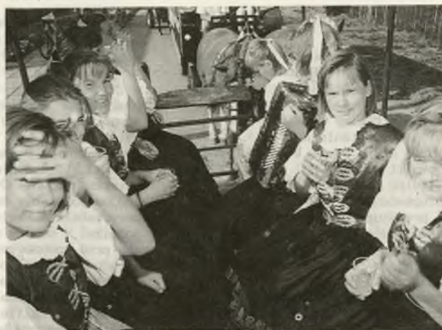
Na Stupavských hodoch nechýbal Stupavjáneček