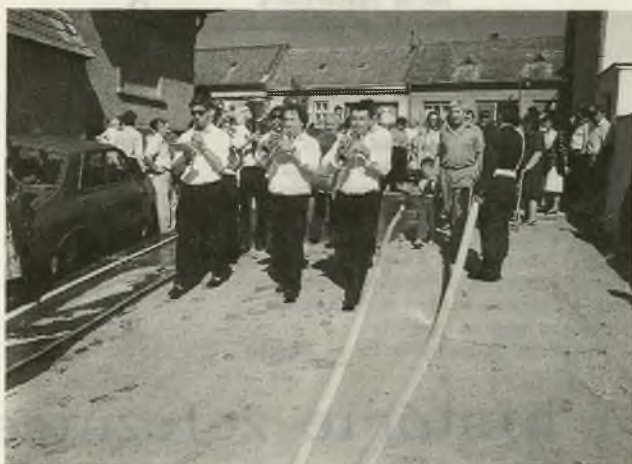
Na mástskych hodoch nechýbala Veselá muzika

Stupavské hody sú vždy vyvrcholením letnej sezóny a stávajú sa nedeliteľnou súčasťou spoločenského a kultúrneho života nášho mesta. Tohoročné Hody zachytil fotograf p. Paleček a urobil tak podrobnú reportáž z podujatí. Zachytil otvorenie výstavy venova-