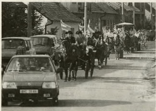
Tradičný hodový sprievod na vozoch