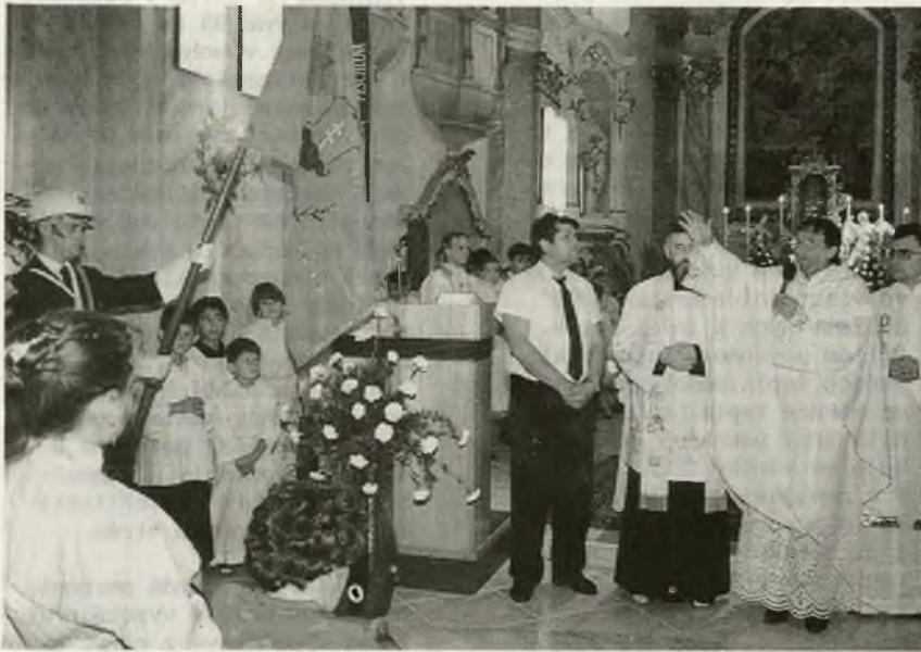
Historické zástavy hasičských zborov Stupavy a Mástu boli opäť posvätené