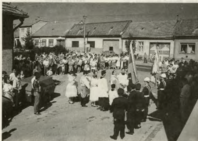
Posviacka obrazu sv. Rócha v Maste