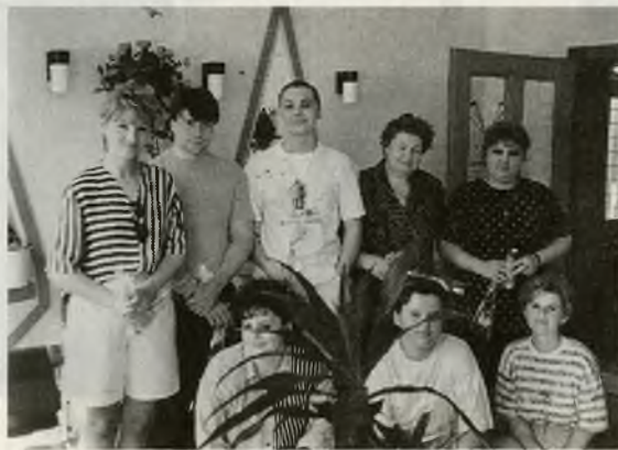
Stáli zákazníci kaderníctva boli obdarovaní