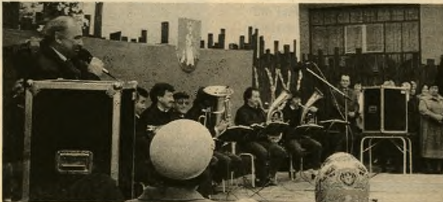
Veselá muzika zachranovala náladu, stále sa mračilo, ale dobrá pesnička rozžiarila nejednu tvár.