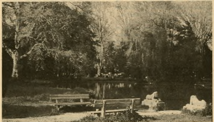
Celkový pohľad na park.

Stupava získala mimoriadne vzácne prostredie, ktoré sa zachovalo možno aj vďaka tomu, že dlhé roky nebolo verejnosti prístupné. Treba sa zamyslieť aj nad ochranou parku, aby mestské -