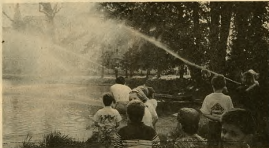
Z ukážky požiarneho zásahu v Zámocskom parku, 2. mája 1993.

Členovia Klubu slovenských turistov absolvovali trojdňový prechod Nízkymi Tatrami. Najzaujímavejší bol výstup na Baranec v Západných Tatrách. Akciu organizoval KST TJ Tatran Stupava a bola otvorená pre ostatné kluby okresu. Podujatia sa zúčastnilo cca 70 turistov a ochrancov prírody.