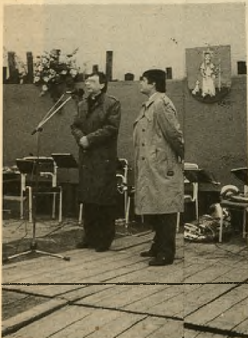
Prítomných oslovili primátor mesta a stupavský pán farár.