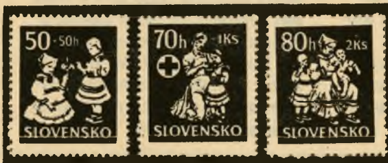
Dobročinné známky v prospech sociálnej starostlivosti, vy- dané 8.11.1943