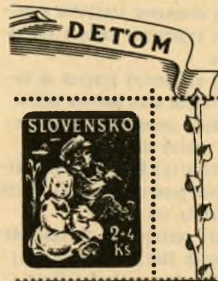
Príplatkové známky v prospech staro- stlivosti o mládež, vydaná 18.12.1944.