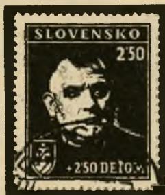
Príplatková známka v prospech detí, vydaná dňa 2.11.1939.

Venujeme slovenským známkam, ktoré boli vydané v prospech starostlivosti o deti a mládež.