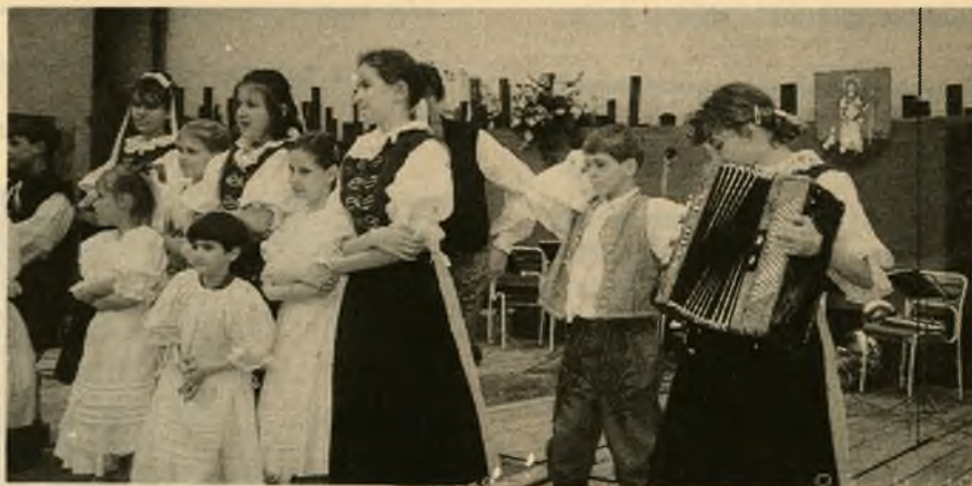
V kultúrnom programe vystúpil detský folklórny súbor Stupavjáneček s pásmom detských hier, piesní a tancov.