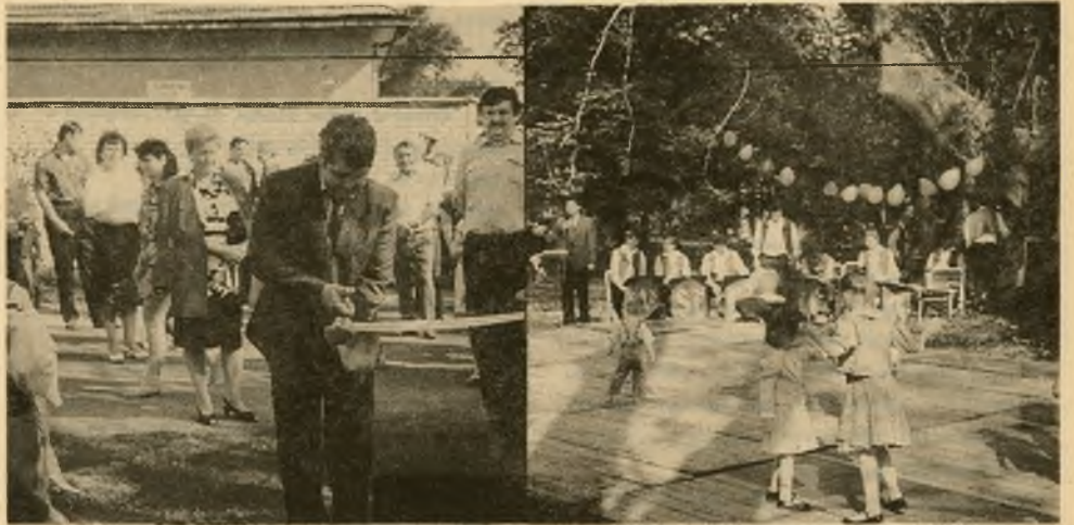
Primátor otvára Zámocký park prestrihnutím pásky.