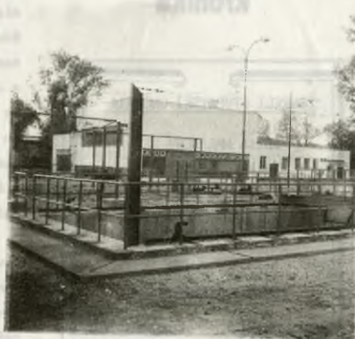
Dažďová nádrž s pojazdovým stieracím mostom, v pozadí prevádzková budova a budova čerpacej stanice