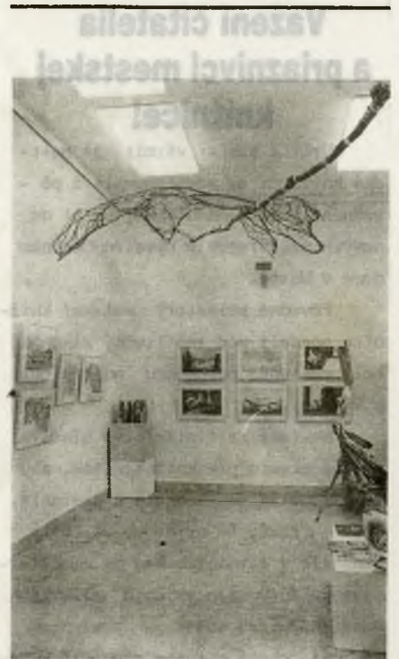
Reinštalácia výstavy, pre záujem švédskej ambasády, bude v Trenčíne v Mestskom kultúrnom dome dňa 4.XII. 1992.

Pre výtvarno-priestorové riešenie výstavy zrealizovali žiaci výtvarného odboru v Stupave objekty inšpirované hlavne jednou z najznámejších kníh Astrid Lindgrénovej, Pipi Dlhá Pančucha.