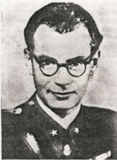
KPT. JÁN NÁLEPKA HRDINA ZSSR

Ak hodnotíme J. Nálepku ako pedagóga, mal všetky vlastnosti ľudového učiteľa. Svoje povolanie nikdy nebral formálne, zamestnanecký, ale vždy pristupoval zodpovedne k riešeniu problémov školy a výchovy.