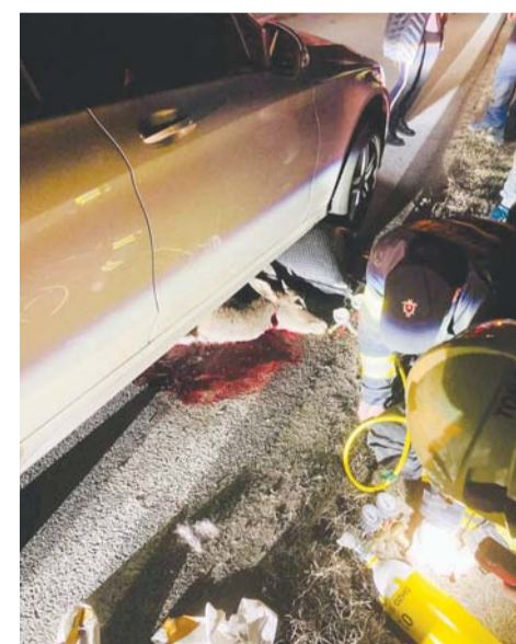
Zrážka raticovej zveri s osobným automobilom na okraji Stupavy. Opatrnosť za volantom je naozaj urgentná výzva.

Radi by sme sa týmto obrátili aj na obyvateľov a apelovali na nich, aby sa počas pobytu v lese pohybovali po vyznačených chodníkoch, nerušili zver hlukom a mali svoje psy na vôdzke. Vzhľadom na nárast turistov, cyklistov a bežcov v priľahlých lesoch, ktorý priniesla pandémia, môže byť zver na svojich ležoviskách neustále rušená. Následne sa sťahuje na polia k cestám,